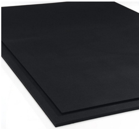
LOSETA DE CAUCHO 10MM 1X1 M - 8,5 KG