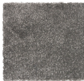
Gris Oscuro 77