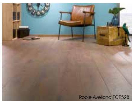
Roble Avellana FCE528

Posibilidad de colocar 120m 2 sin juntas de dilatación Máximo largo 12m / ancho 10m